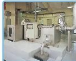
スクリーンユニット