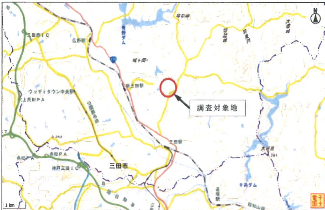
図 1-1 調査対象地（広域）（土地利用履歴調査報告書より抜粋）