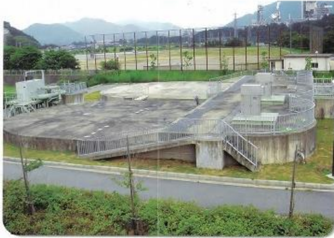
オキシデーションディッチ