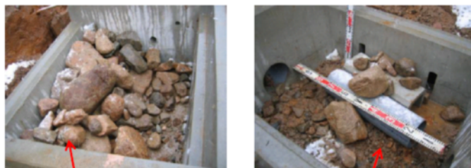
オオサンショウウオ用ブロックの内部には、自然石やパイプを用いて巣穴環境を創出している